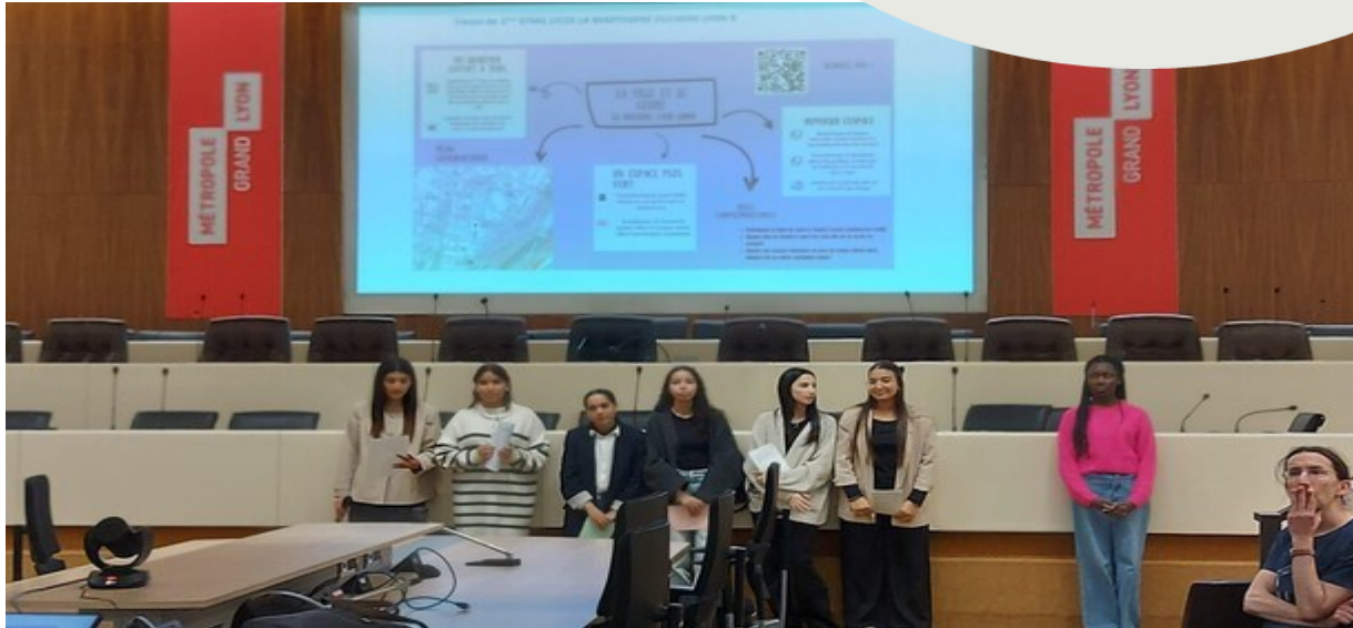
Rectorat de Lyon— Concours TONY GARNIER - Edition 2024 | Académie de Lyon (ac-lyon.fr)