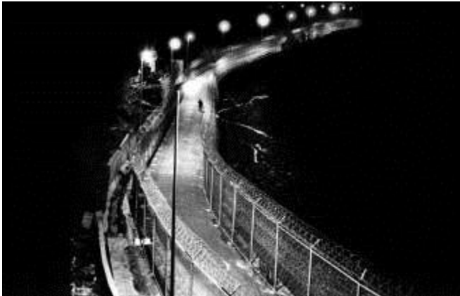
Frontière de Ceuta, 2001. Des postes d'observation, des projecteurs, des caméras infrarouges ainsi qu'une clôture de 3 m de haut hérissée de fils barbelés sont censés dissuader les 10 000 immigrants qui, du côté marocain, attendent une occasion de gagner Ceuta, enclave espagnole au Maroc.