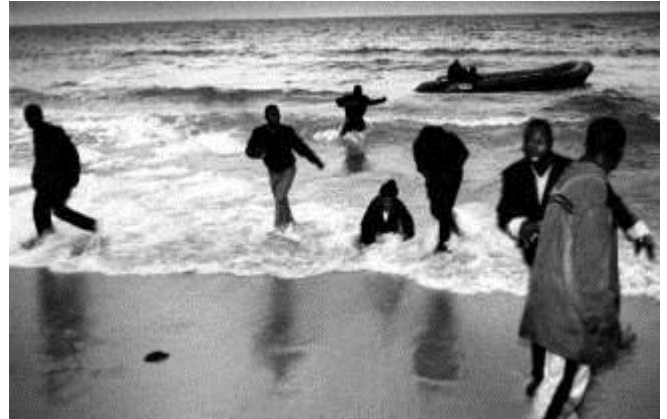
Immigrants débarqués par des trafiquants marocains sur la plage Punta Paloma (Espagne), 2001.

1. Situez les pays où ont été prises ces deux photographies. Ces lieux font-ils partie de l'espace Schengen (dont le principe est la libre circulation des personnes entre les États signataires de l'accord de Schengen) ?