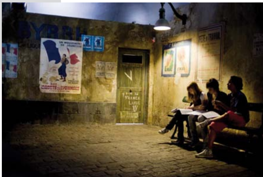
Visite scolaire de l'exposition permanente.