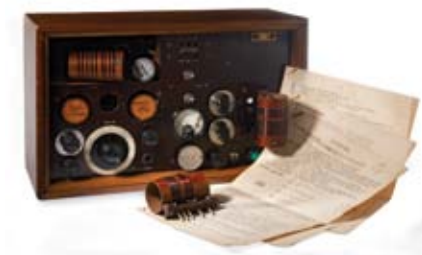
POSTE ÉMETTEUR-RÉCEPTEUR DE TYPE MKV (fonds Greffe, collection CHRD)

Les appareils comme ce poste émetteur-récepteur sont des outils précieux pour la Résistance. Ils jouent un rôle fondamental dans les transmissions clandestines. C'est, avec les émissions radiophoniques diffusées par la BBC, le seul moyen de communication direct entre la Résistance intérieure et Londres, permettant de transmettre des renseignements, comme les mouvements de troupes militaires, ou coordonner des actions précises telles que les parachutages d'armes.