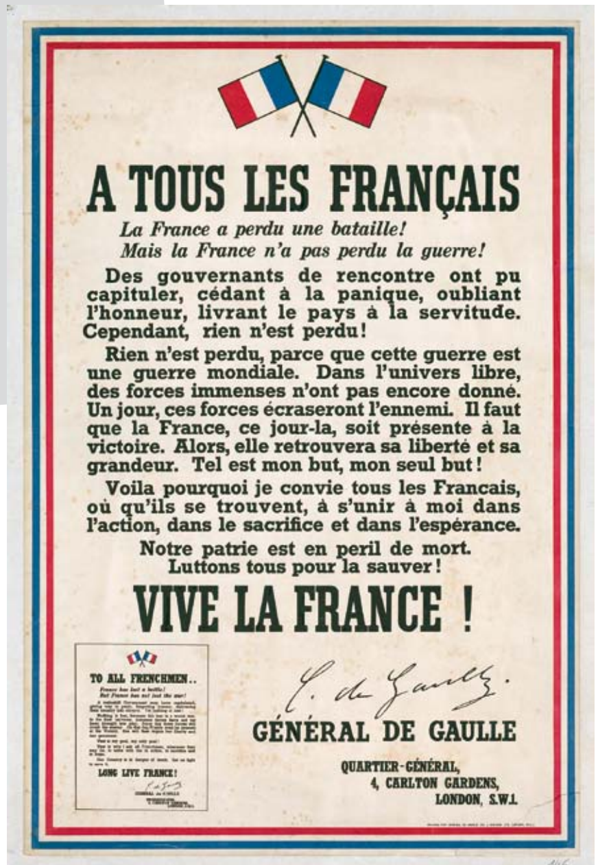
Affiche dite de l'Appel du 18 juin.