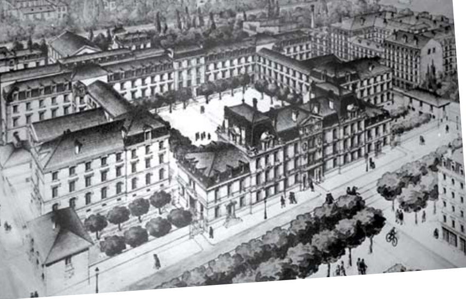
Photographie de l'École du service de santé militaire, extraite de l'album offert par le major-général à Édouard Herriot, alors ministre de l'Instruction publique (1926-1928).