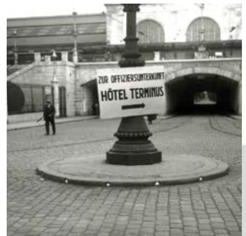
À partir de décembre 1942, l'hôtel Terminus est le siège de la Sipo (police de sûreté).