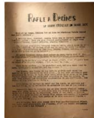
TRACT « RAFLE À DÉCINES » (association des Amis du CHRD)

On mesure difficilement aujourd'hui la prise de risques énorme consentie par les auteurs et les diffuseurs de ce tract, dont le sous-titre « Le devoir d'asile est un devoir sacré » résonne pourtant étrangement avec certains de nos slogans contemporains. Le caractère clandestin du document, la force de sa dénonciation et la qualité du mouvement signataire en font un objet de collection à part entière et permettent d'insister sur l'importance de la résistance intellectuelle.