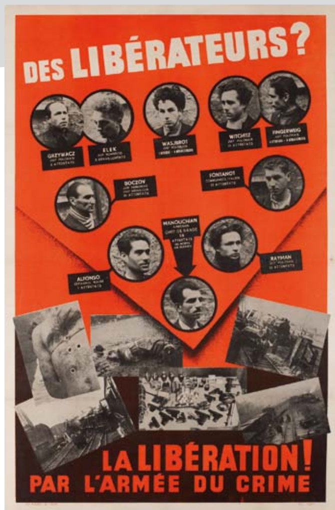
Affiche rouge.