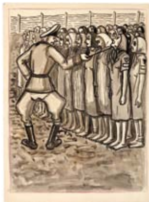
DESSINS DE RAVENSBRÜCK (fonds Clavreul, association des Amis du CHRD)

Ces dessins constituent un remarquable témoignage de la vie des femmes déportées au camp de Ravensbrück. Ils attestent également de la production artistique et culturelle dans les camps et permettent de mesurer l'énergie et l'ingéniosité déployées par les déportés pour réunir les matériaux et les conditions nécessaires à la création dans le contexte d'extrême dureté des camps.