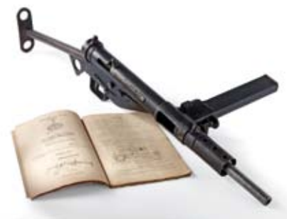
MITRAILLETTE STEN MK II À CROSSE SQUELETTE (fonds Deville, association des Amis du CHRD)

La guerre et la Résistance ne peuvent être abordées sans évoquer la lutte armée et présenter des armes. La mitraillette Sten est l'une des armes emblématiques de la période de la Seconde Guerre mondiale : elle est le symbole du partisan ou du maquisard.