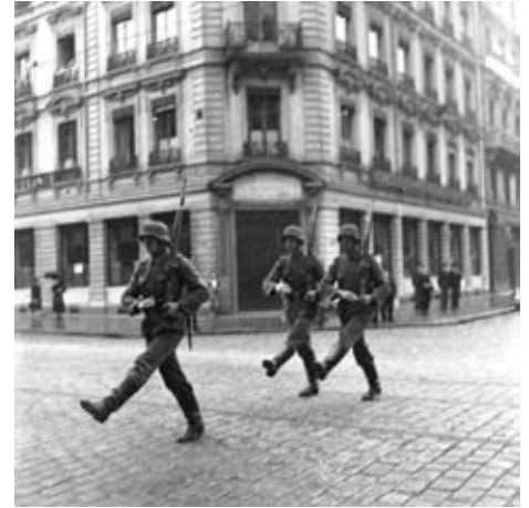
Soldats allemands, rue de la République à Lyon.

Enfin, Charles Bobenrieth a été particulièrement sensible à l'empreinte, dans la ville, des traces de l'occupation allemande et a réalisé quelques très impressionnantes photographies illustrant la débâcle et l'accueil des réfugiés à Lyon en 1940. Ses images, qui s'attachent à saisir la signalétique allemande en place dans la ville, accompagnent l'approche géographique du parcours d'exposition.