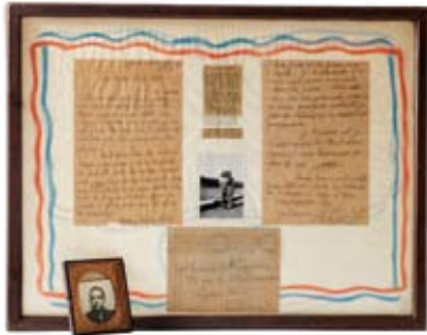
LETTRÉ DU JEUNE FUSILLÉ HENRI MAZUIR

Derniers mots écrits avant la mort annoncée, les lettres de fusillés pendant la Seconde Guerre mondiale constituent un matériau d'une rare authenticité, des archives sensibles pour appréhender et comprendre la Résistance française et ses acteurs. À travers les mots et les phrases, ces documents permettent d'approcher au plus près les résistants, ces héros pour la plupart anonymes, deviennent alors réels, familiaux et intimes.