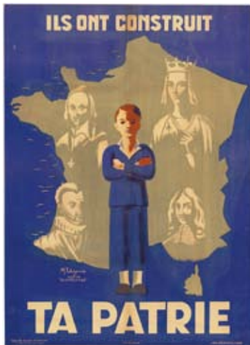
AFFICHE DE L'ÉQUIPE ALAIN-FOURNIER (collection CHRD)

Tandis que les thématiques abordées éclairent sur les grands axes de la Révolution nationale, le style facilement identifiable – traitement graphique résolument optimiste, lisibilité directe avec la lettre mise en avant, en forme de slogan, en haut et en bas d'une composition géométrique, des images fortes, symboliques, aux lignes nettes – de cet ensemble d'affiches permet d'appréhender les mécanismes de base de la propagande par l'image.