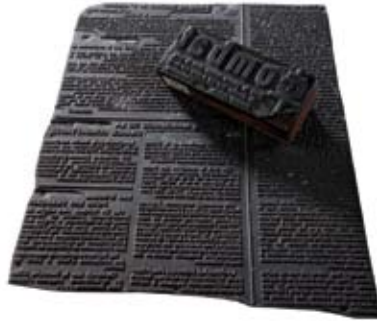
COMBAT, ÉDITION SPÉCIALE, NOVEMBRE 1943 – PLOMB LOGOTYPE ET PLAQUE DU PREMIER EXEMPLAIRE DATÉ DE DÉCEMBRE 1941 (fonds Soucelier, association des Amis du CHRD)

La presse clandestine a joué un rôle essentiel dans la Résistance, qu'illustrent la reconstitution de la cave aménagée en imprimerie clandestine ainsi que cet ensemble d'objets.