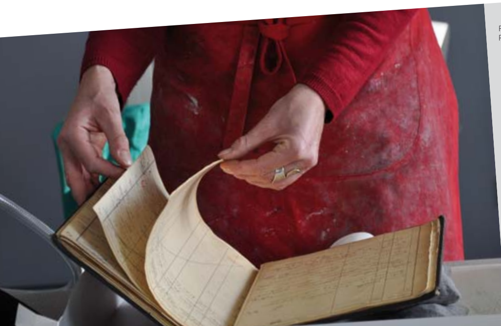
Restauration de documents de la collection papier.