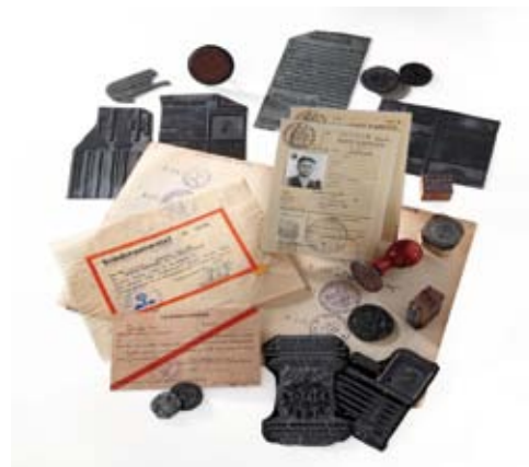
Ensemble d'objets utilisés pour la fabrication des faux papiers. Fonds Babaz, association des Amis du CHRD.