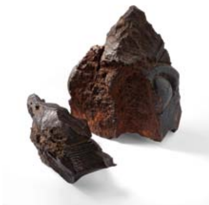
DEUX ÉCLATS D'OBUS, MAI 1944 (fonds Pey, collection CHRD)

Ces deux morceaux de fonte permettent d'évoquer un épisode important de l'histoire du bâtiment qui accueille actuellement le CHRD. En effet, l'ancienne École du service de santé militaire, réquisitionnée par l'occupant en mars 1943 pour y installer la quatrième section du Sipo-SD (connue sous le nom de Gestapo), a vu sa physionomie totalement bouleversée par le bombardement du 26 mai 1944.