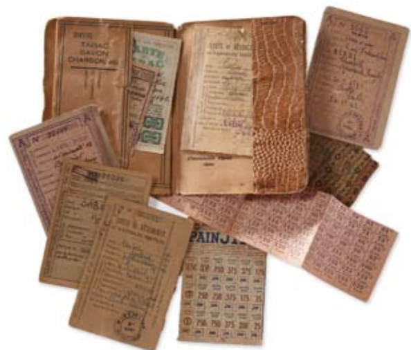
Carnet et lot de tickets de rationnement. Fonds Lévy, collection CHR D ; fonds Cartet, association des Amis du CHR D.