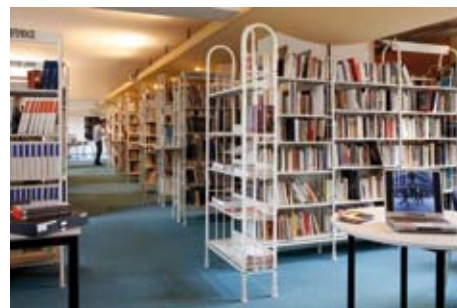
Le centre de documentation.

Le Centre d'Histoire est, par essence, un musée consacré à l'histoire de la Seconde Guerre mondiale, mais sa programmation culturelle réalise un aller-retour permanent entre les problématiques issues de la période 1939-1945 et leur portée dans la sphère contemporaine. Régulièrement, le CHRD propose au public des expositions en lien avec l'histoire immédiate et la défense des droits de l'homme. Celles-ci sont présentées dans une vaste salle, située dans les sous-sols du bâtiment : d'anciennes caves voûtées ponctuées de piliers en pierre dans lesquelles étaient recluses les victimes de la Gestapo.