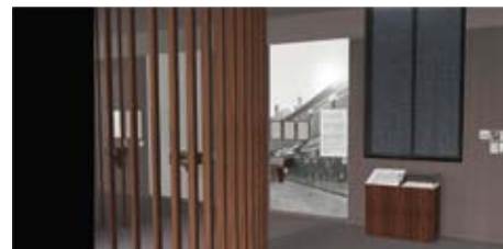
Vue de la nouvelle scénographie. Visuel Alice dans les villes

Aux côtés des trente points de témoignages audiovisuels, trois cartographies interactives (Jean Moulin à Lyon, Les lieux de la Résistance et Imprimeries clandestines) ponctuent le parcours. La mise en place de ce dispositif découle d'une approche topographique des événements et de la volonté d'identifier les lieux marqués par l'histoire de la Seconde Guerre mondiale dans la ville. Ces cartographies font écho aux balades urbaines, proposées ponctuellement par le musée depuis 2010 et qui connaissent un grand succès auprès des publics.