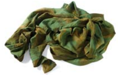
FRAGMENT DE PARACHUTE DE JEAN MOULIN

Au regard de la figure de Jean Moulin et de son action, ce fragment de parachute peut paraître aujourd'hui dérisoire. Pourtant, si nous connaissons bien, notamment grâce aux travaux de Daniel Cordier, l'action de Jean Moulin en 1942 et 1943, s'il est possible de retrouver les lieux où il a agi à Lyon, à Paris ou en Provence, nous disposons de peu d'éléments matériels (photos, objets familiaux) pour évoquer ses mois de clandestinité. La place de cet objet au sein des collections et sa présentation dans l'exposition permanente est significative, tant de l'importance de son action à Lyon que de la mémoire qui s'est construite autour de « l'unificateur de la Résistance ».