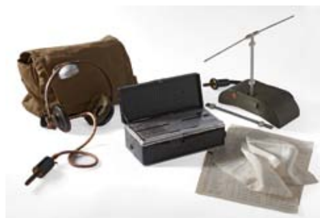
Matériel émission/réception et messages codés servant aux opérations atterrissages et parachutages. Fonds Rivière, collection CHRD. Photo Pierre Verrier