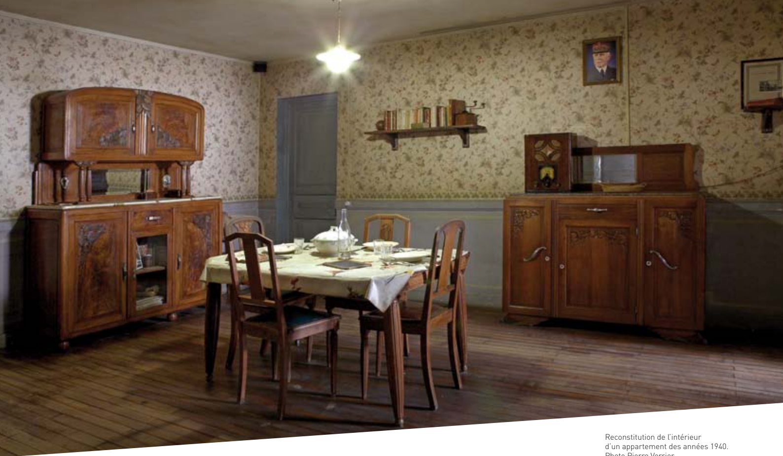
Reconstitution de l'intérieur d'un appartement des années 1940.