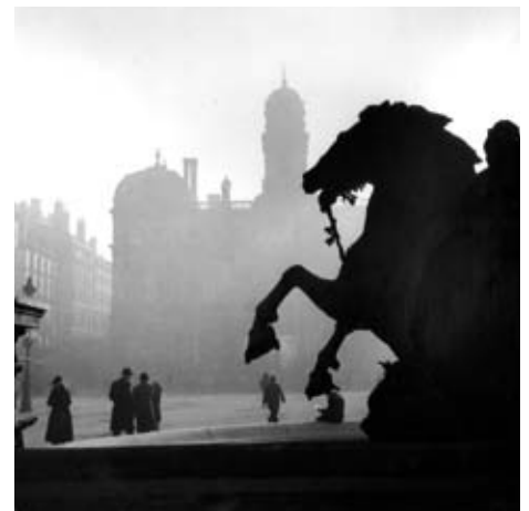
Place des Terreaux, hiver 1942-1943.