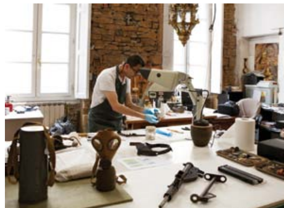
Restauration d'objets de la collection métal.

Parmi les fonds remarquables, il est possible de citer les quelque 700 témoignages audiovisuels recueillis par le CHRD autour des corpus Résistance et Déportation, une collection de plus de 400 partitions de chansons d'époque, ainsi qu'une collection de plus de 300 affiches. Et enfin, les fonds émanant des grandes figures de la Résistance locale comme les archives de Paul et Geneviève Rivière, déposées au musée en 2000. La richesse des pièces rassemblées dans ce fonds, nourri des commentaires personnels de Paul Rivière, croisé avec les témoignages de plusieurs de ses adjoints permet de mieux connaître l'organisation de la section atterrissage-parachutages (SAP), service clé des réseaux d'action de la France combattante, aspect de la lutte armée souvent méconnu du public.