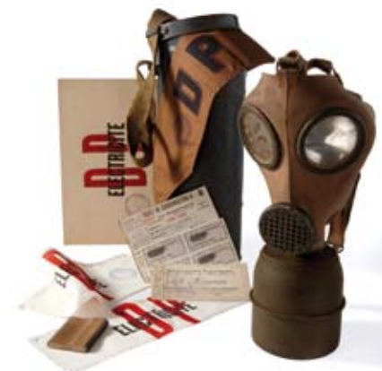
MASQUE À GAZ ET SON ÉTUI

Pour les Français de l'époque, cet objet est le signe visible de l'imminence d'un conflit. Il témoigne de l'atmosphère qui règne à Lyon comme dans toutes les villes de France depuis 1938, année où la montée vers la guerre semble inéluctable.