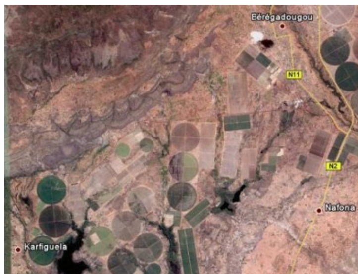
Image satellite servant au croquis