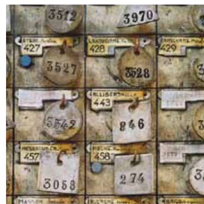
Jetons de pointage suspendus au panneau portant les noms des mineurs Lampisterie du Puits Couriot