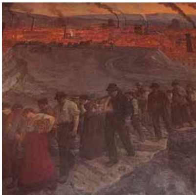
Tableau Les Mineurs , J-P Laurens