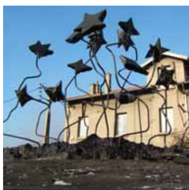
Monument aux victimes de la fusillade du Brûlé, La Ricamarie