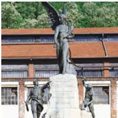
Monument aux victimes de la guerre et du devoir, cour d'entrée du Puits Couriot

Le Puits Couriot, important site industriel stéphanois, a été le témoin des bouleversements du XX e siècle : Première et Deuxième Guerres mondiales, la reconstruction, les Trente Glorieuses, jusqu'à l'abandon du charbon.