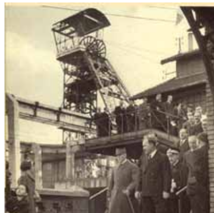
P. Pétain visitant le puits Couriot, mars 1941

Consultez le dossier pédagogique spécifique pour préparer et approfondir votre visite ( en cours de réalisation ).