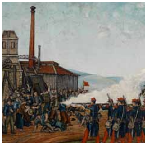
Fusillade du Brûlé (1869), Tableau de Morel, Collection Puits Couriot / Parc Musée de la Mine

Consultez le dossier pédagogique spécifique pour préparer et approfondir votre visite ( en cours de réalisation ).