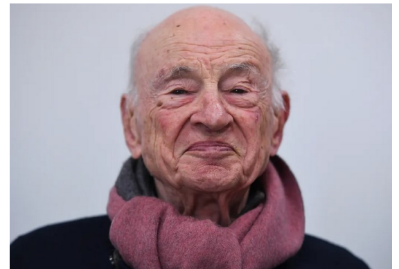
Edgard Morin

https://www.franceinter.fr/emissions/l-invite-de-8h20-le-grand-entretien/l-invite-de-8h20-le-grand-entretien-25-juin-2020