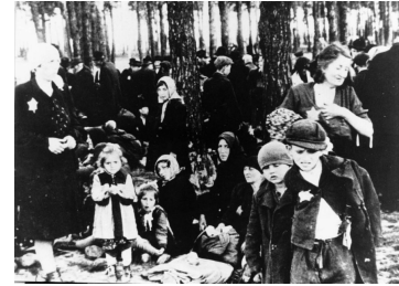
Album d'Auschwitz