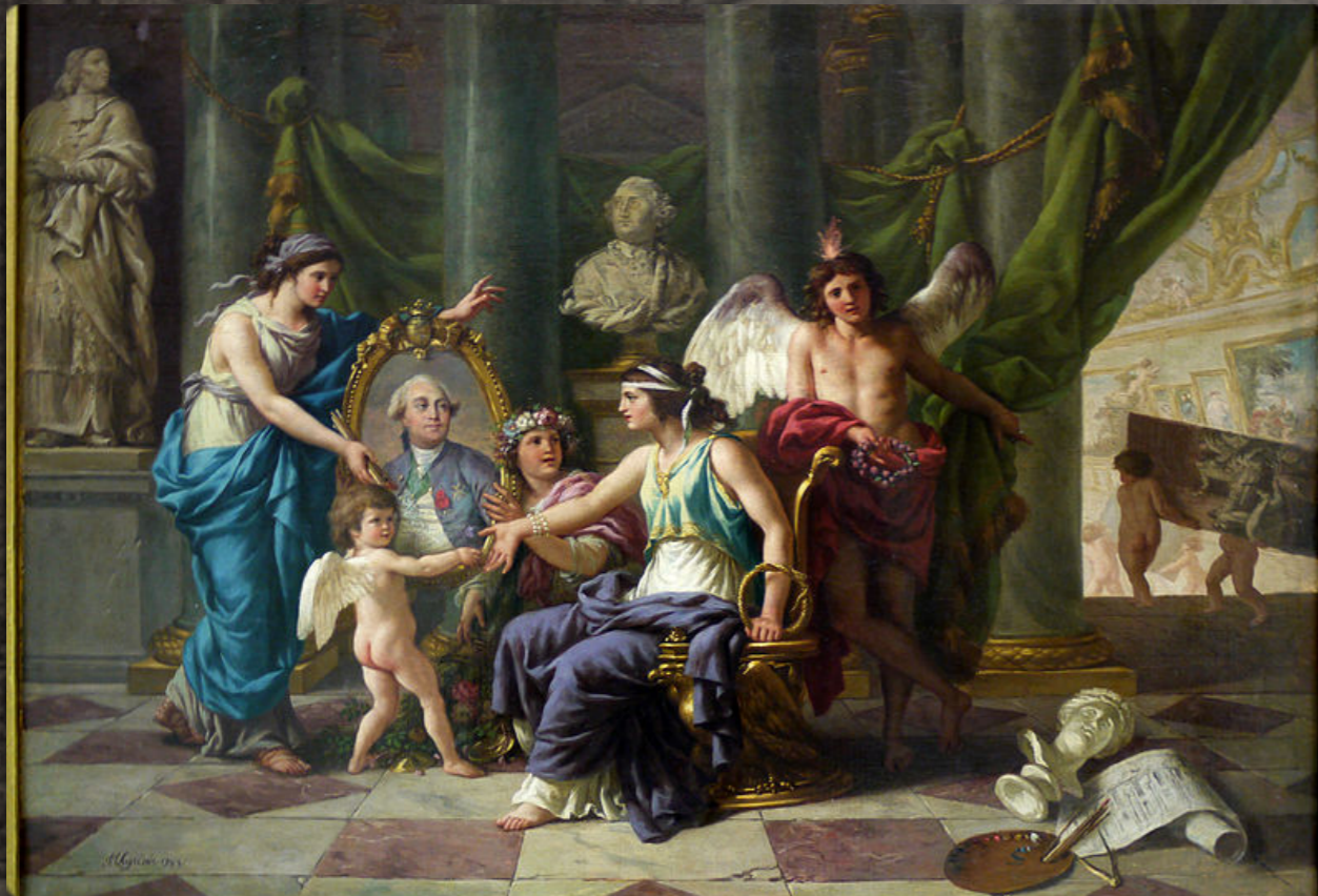
Jean-Jacques LAGRENÉE le Jeune - Paris, 1739 - Paris, 1821 - Allégorie relative à l'établissement du Muséum dans la Grande Galerie du Louvre. 1783. © Musée du Louvre

Le Museum central des Arts ouvre ses portes le 10 août 1793. Placé sous l'autorité du ministre de l'Intérieur, il est administré par les peintres Hubert Robert, Fragonard, Vincent, le sculpteur Pajou et l'architecte de Wailly. Gratuit, il est ouvert en priorité aux artistes, et au public en fin de semaine. Les œuvres, pour la plupart des peintures des collections royales ou des saisies des biens des émigrés sont disposées dans le Salon Carré et la Grande Galerie.