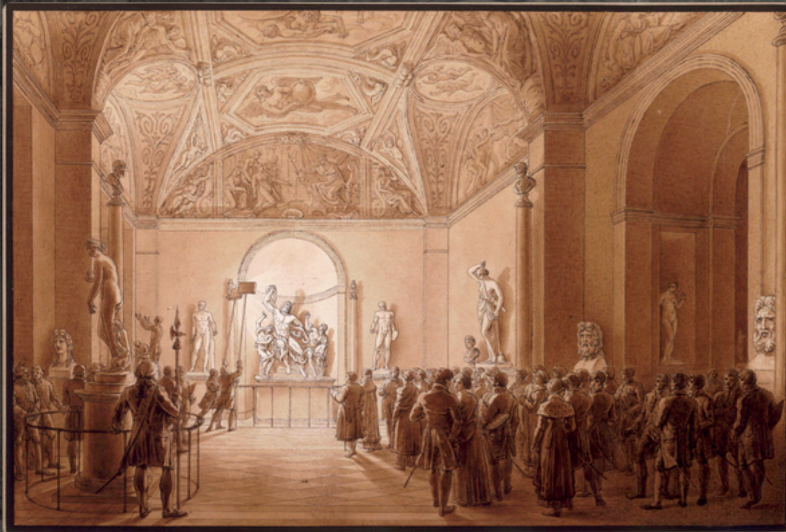
Benjamin Zix (1772-1811), Visite aux flambeaux faite par l'empereur et l'impératrice, Salle du Laocoon du Louvre, vers 1810, encre brune, encre grise, lavis brun, dessin à la plume, 26 x 29 cm (Musée du Louvre, Paris)

Le 9 novembre 1800, anniversaire du coup d'Etat du 18 brumaire, Bonaparte et Joséphine inaugurent le musée des Antiques, aménagé dans l'ancien appartement d'été d'Anne d'Autriche, au rez-de-chaussée du Palais, dont le sol peut supporter le poids des marbres. On y admire les antiques provenant du Vatican, du musée du Capitole et de Florence, mais aussi des anciennes collections royales ou d'émigrés.