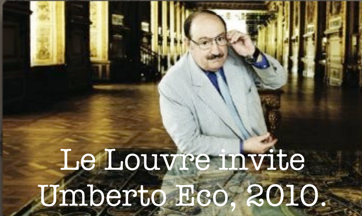
Le Louvre invite Umberto Eco, 2010.